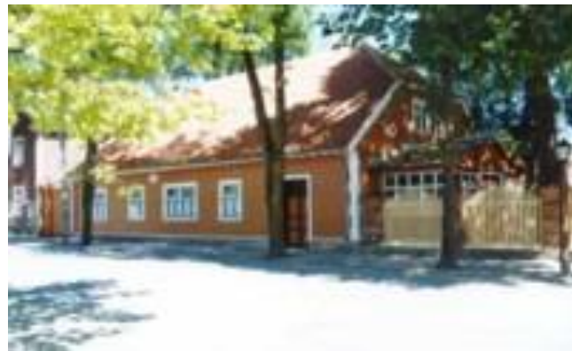
Museum, f.d. apotek i Werro

Det blir ingen fästning som Ivangorod eller Narva. På stadens karta ett årtionde efter uppförandet finns en ”Casernenstrasse” markerad, vilket tyder på en kasern eller militäranläggning av något slag, dock borgen förblir ruin. Det blir en trädgårdsstad istället, med bostadshus mot gatan och tio gånger så mycket trädgårdsareal bakomliggande. Förebilden var Thomas Mores Utopia , staden Amauroton med torg och rådhus i mitten, allt stramt symmetriskt. Också en tysk och en rysk kyrka uppförs vid torget i stadens centrum, från vilken ”Catharinen Allee” löper mot sjön. Innebörden av utopin verkar man ha förbisett då: Amauroton stod för en sorts agrarrepublik, ja rentav ett kommunistiskt samhälle inspirerat av de spanska conquistadorernas berättelser om Inkariket.