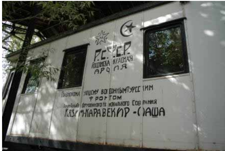
I denna tåg-vagn signerades 1921 års Karsprotokoll. Notera den revolutionära ryska stavningen.